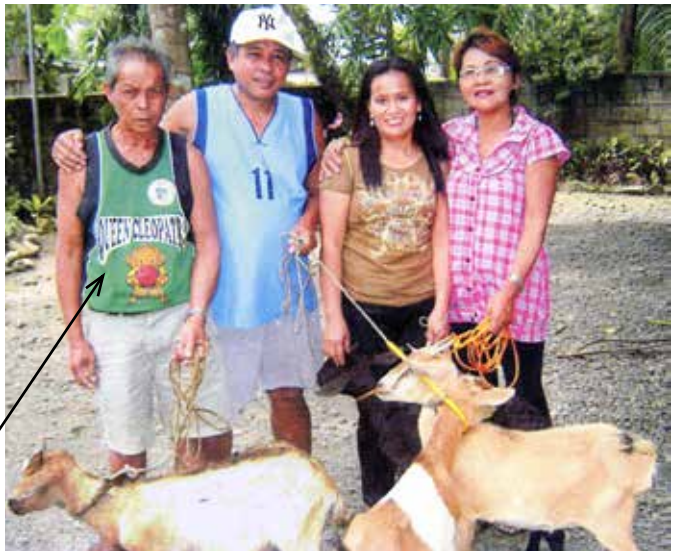
Geitjes voor Opa die slechtiende is

Opnieuw zijn er dit halfjaar nieuwe verzoeken binnengekomen voor kleinschalige hulp. Uit de Filipijnen, India en Nieuw Guinea is om hulp gevraagd voor ouderen die geen enkele bron van inkomsten hebben. (werkloze en/of ouderdom uitkeringen bestaan er voor de meeste mensen niet) Daarnaast is er hulp gevraagd voor zwaar gehandicapte kinderen waaronder weeskinderen. Aan schoolhulp zoals het afbouwen van schoollokaaltjes