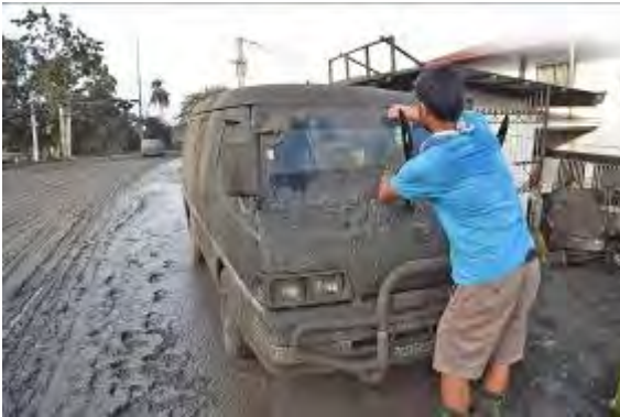
Alles is vervuild door de asregen.

erbarmelijke omstandigheden eigenlijk maar moeilijk zijn te beschrijven. In een aantal landen durven onze contactpersonen maar mondjesmaat de deur uit, omdat het gewoon te gevaarlijk is. Recentelijk hebben we ook slechte berichten uit de Filipijnen ontvangen in verband met de uitbarsting van de Taal-vulkaan. De bevolking die in de buurt van de vulkaan woont, is geëvacueerd. Ook door ons ondersteunde families wonen in dat gebied